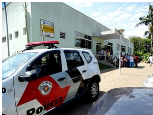
Polícia defronte ao laboratório de química da USP.